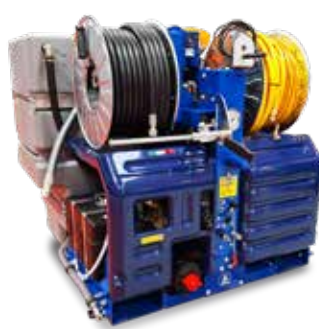
Version with electric powered hose reel Versione con avvolgitubo elettrico