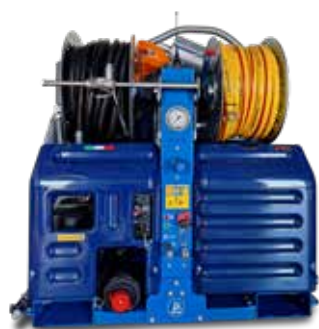
Standard version Versione Standard