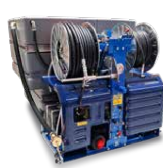
Version with 2 HP hose reel HP (electric and manual) Versione con 2 avvolgitubo HP (elettrico e manuale)