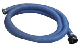
5 m hose Ø 60 mm for suction with quick coupling 5 mt tubo Ø 60 mm per l'aspirazione con innesto rapido