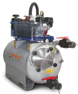
Version with electric motor Versione con motore elettrico