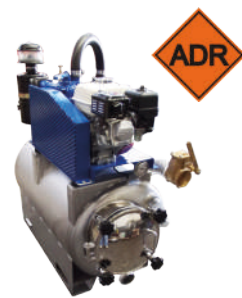
ADR version Versione ADR